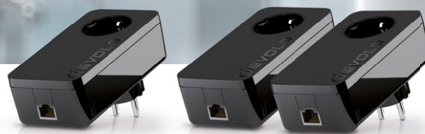
Single Adapter Art.: 9554 (DE,AT)