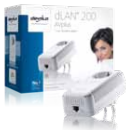
dLAN ® 200 AVplus