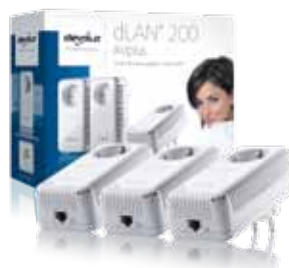
dLAN ® 200 AVplus Network Kit