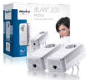
dLAN ® 200 AVplus Starter Kit