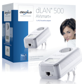
dLAN® 500 AVsmart+