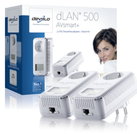
dLAN® 500 AVsmart+ Starter Kit