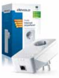
dLAN® 650+ Complemento