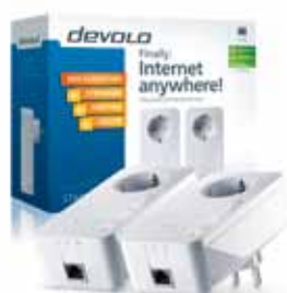
dLAN® 650+ Starter Kit