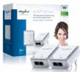
dLAN® 500 duo Starter Kit