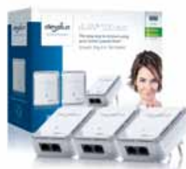
dLAN® 500 duo Network Kit