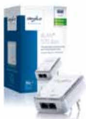
dLAN® 500 duo

2 conexiones de red Fast Ethernet; con la segunda conexión de red LAN podrá integrar un dispositivo adicional cuando lo desee.