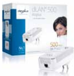
dLAN® 500 AVplus