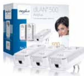
dLAN® 500 AVplus Network Kit