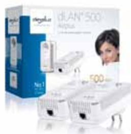
dLAN® 500 AVplus Starter Kit